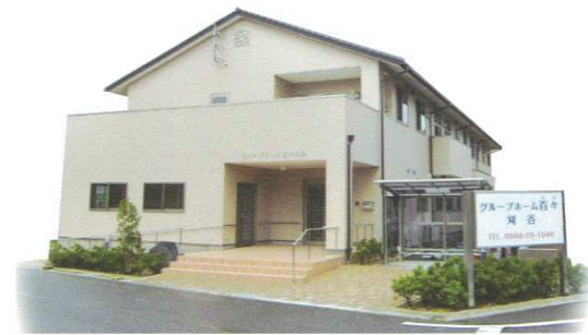
認知症対応型 共同生活介護 グループホーム百々 刈谷