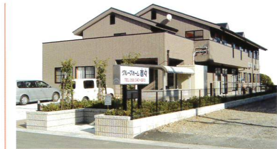
認知症対応型 共同生活介護 グループホーム 百々