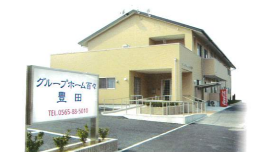
認知症対応型 共同生活介護 グループホーム百々 豊田