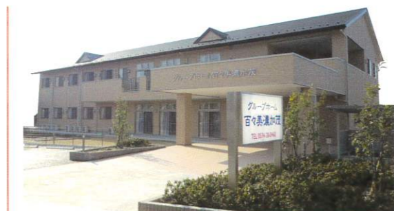
認知症対応型 共同生活介護 グループホーム百々 美濃加茂