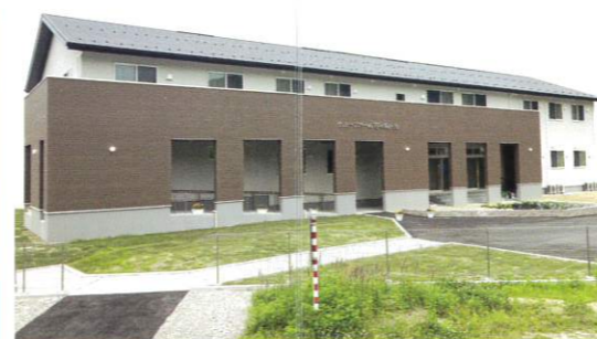
認知症対応型 共同生活介護 グループホーム百々 鞍ヶ池