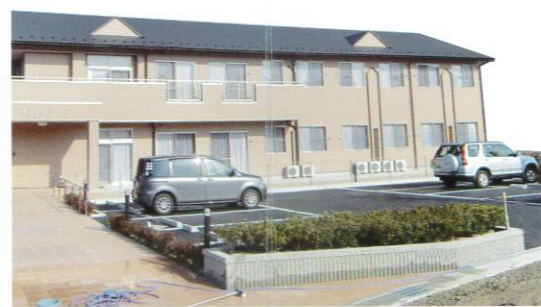
認知症対応型 共同生活介護 グループホーム百々 各務原