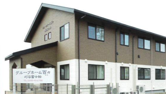
認知症対応型 共同生活介護 グループホーム百々 刈谷富士松