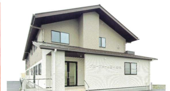
認知症対応型 共同生活介護 グループホーム百々 安城