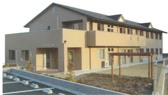
認知症対応型 共同生活介護 グループホーム百々 春日井